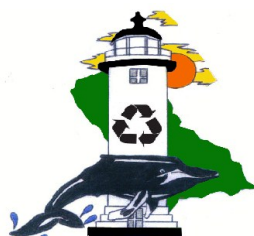
Logo oficial de Reciclaje