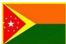
Bandera de Rincón